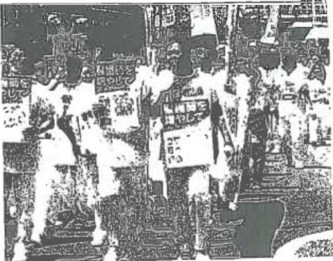
看護師増員などを訴え白衣姿でデモ行進する医療従事者ら一豊橋駅前

予算の大幅増を要請する署名活動を行った後、のほりを掲げて駅周辺をデモ行進し、地域医療を守れ」「医師・看護師が足りない」などとシブレットコー 【丸林康樹】