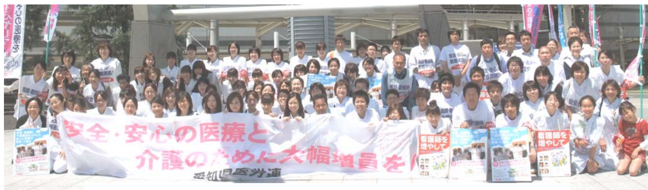
全体参加者でスマイル・記念撮影