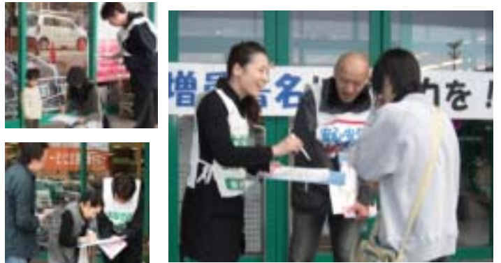
<能代会場の署名行動>