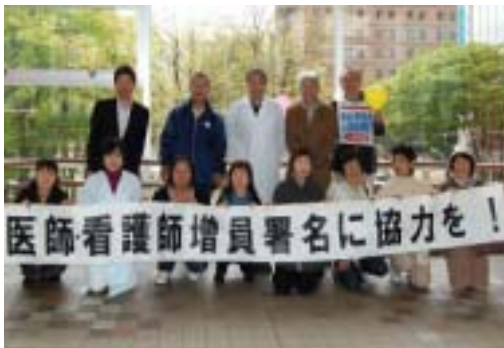
<秋田会場の署名行動>