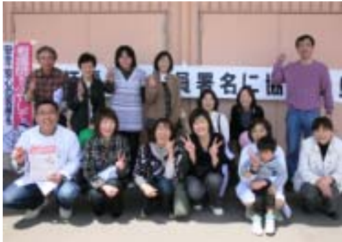
<上：大館会場、右下：大館会場>

イオンスーパーセンター大館店では秋厚労北秋支部・鹿角支部、公立米内沢総合病院労組の14名が参加しました。署名を断る方はほとんどなく、多くの市民の皆さんに快く協力いただき432筆が集約されました。イオン内の美容室では、店長自らが署名用紙を店内に持ち込み、お客さんに署名をすすめてくれるなど協力的でした。新聞社3社が取材をしました。