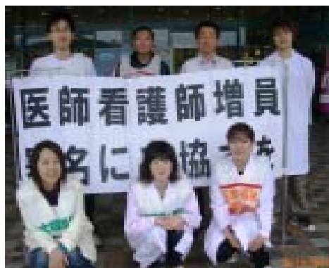
<横手会場の署名行動>