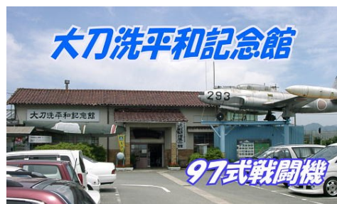
大刀洗平和記念館・外観

世界で唯一、復元された97式戦闘機を見ることができる「大刀洗平和記念館」。西日本陸軍航空隊の発祥の地である大刀洗基地では、太平洋戦争末期、多くの少年兵が知覧などの特攻基地へと飛び立っていきました。館長さんが熱心に説明してくれます。また秋月の紙すき体験では、柔らかな風合いのハガキを漉きます。紙すき800円と平和資料館450円（団体料金）で計1250円が必要です。