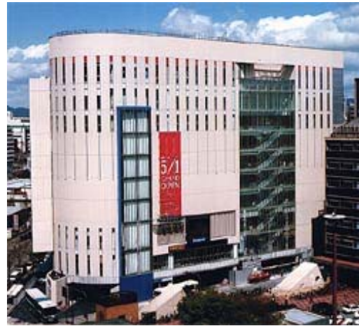
博多駅交通センター3Fバス乗り場（博多口を出てすぐ右の方に見えます！）