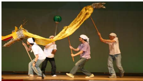
オープニングは、長崎名物 「蛇踊り」 から