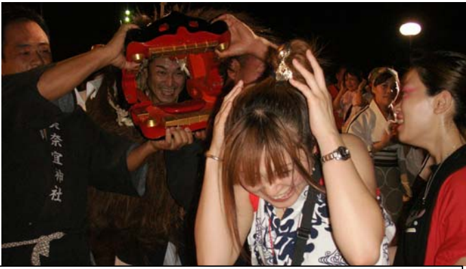
獅子舞に唾まれてご利益ありますよ☆ でも、実は獅子舞の中には・・・。