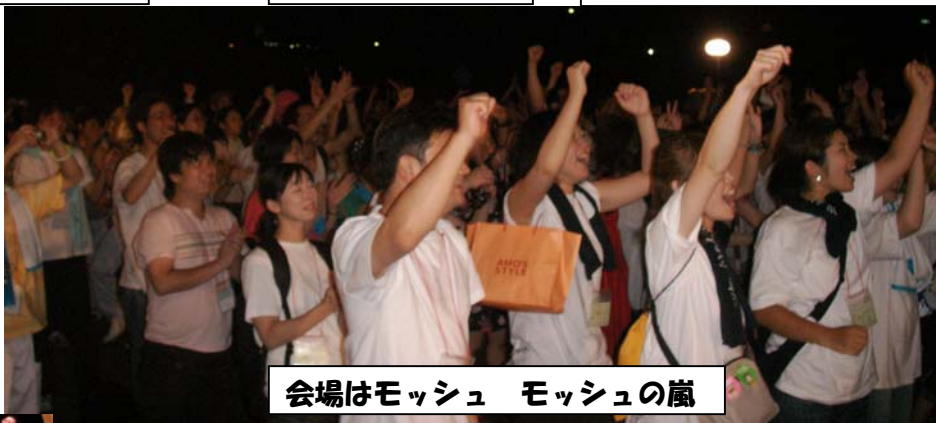
会場はモッシュ モッシュの嵐