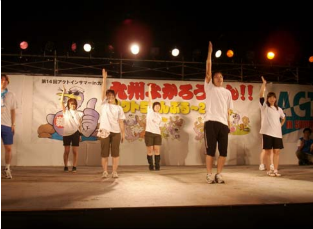
↑関東甲信越フロック出し物 (筋肉体操) みんなひきしまってるね～