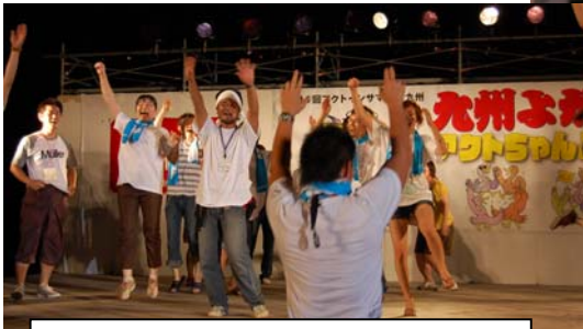
北海道 (アクト名物イカ踊り)