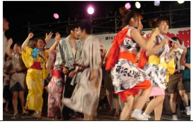
↑東北フロック (ねぶた祭り) 跳ねて、跳ねて、跳ねまくれー