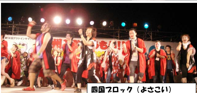
四国フロック (よさこい)