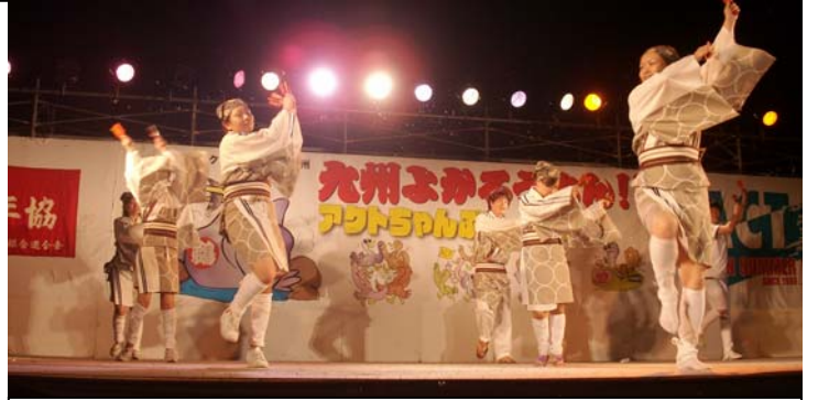
↑四国フロック 少なくとも心配してたけど、全然問題な～い!