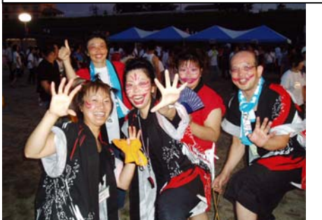
中国フロック・We Are 鬼