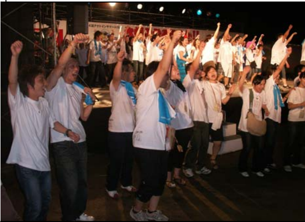
祭りの最後はアクト開催地九州ですたーい。